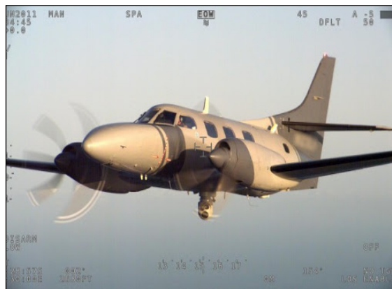
L'avion de surveillance luxembourgeois Merlin III