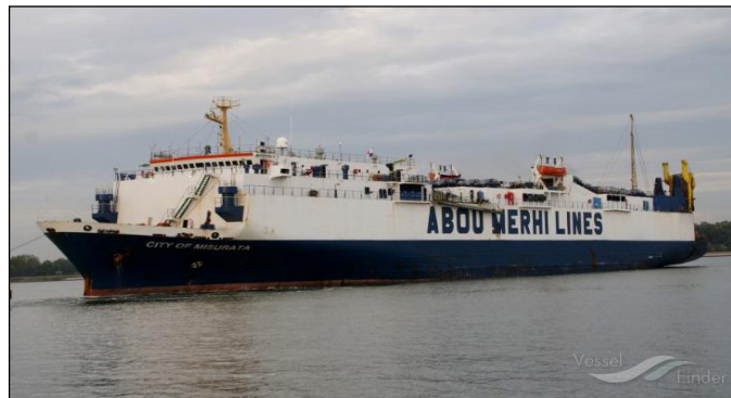
Le cargo libanais Bana impliqué dans le transport d'armes vers la Libye

L'offensive engagée en avril par le maréchal Haftar lui a permis de s'emparer de Syrte et de marcher en direction de Tripoli. Face au risque de défaite militaire du GNA, la Turquie a fait parvenir des renforts en hommes (dont des supplétifs syriens encadrés par des conseillers turcs) et en matériel lourd transporté par voie maritime. C'est notamment le cas du cargo libanais Bana escorté par les frégates turques Goksu et Gökova , repéré le 27 janvier par le groupe aéronaval du porte-avions Charles de Gaulle . Ces renforts ont permis au GNA d'infliger le 18 mai un revers à l'ALN avec la reprise de la base aérienne de Watiya, située à 130 kilomètres de Tripoli, ainsi que les villes côtières de Sabratha et Sorman, situées à l'ouest de Tripoli. Cette victoire n'a été rendue possible que par la forte implication des forces turques et notamment de sa marine devant le littoral libyen. La Russie et l'Égypte ne pourront rester sans réagir.