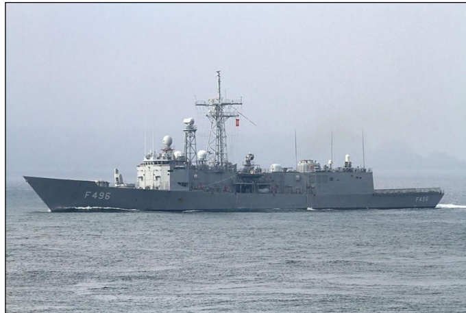
La frégate turque Gökova au large de la Libye

Depuis plusieurs mois, la marine turque est de plus en plus présente en Méditerranée centrale et orientale. Les escortes militaires de navires scientifiques dans la zone économique (ZEE) de Chypre, les actions de harcèlement dans la mer territoriale grecque en mer Egée et la présence de plusieurs frégates devant le littoral libyen et leur participation aux opérations militaires sont autant de marques de la détermination de la Turquie à peser dans le cadre géopolitique méditerranéen. Dans ces conditions, il n'est probablement pas envisageable de voir un navire européen de l'opération IRINI procéder à une visite, même en haute mer, d'un navire de commerce, cargo ou pétrolier, escorté par une frégate turque. Alors l'opération IRINI ne servirait-elle à rien, dès son lancement ? Pas tout à fait. En effet, IRINI traduit le retour en Méditerranée après la fin de SOPHIA de l'Union européenne qui n'y avait plus de présence pratique depuis deux ans. Or il est nécessaire que l'Union européenne soit présente dans une zone aussi sensible que la Méditerranée centrale et qu'elle y dispose des moyens de surveillance et d'observation pour une connaissance précise de la zone et de l'activité militaire de toutes les parties impliquées dans la lutte pour le pouvoir en Libye.