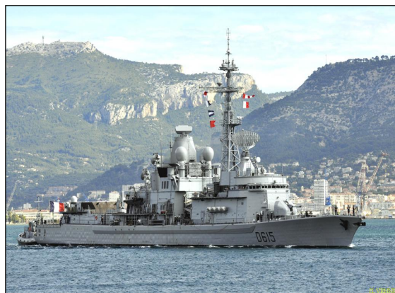
La frégate Jean Bart appareille de Toulon

Reprenant l'organisation de SOPHIA, l'opération IRINI dispose d'un état-major situé à Rome, commandé par un amiral italien et assisté d'un amiral français nota 1 . Il reste encore à désigner un commandant de la force en mer. A cet égard, la Grèce se propose de fournir un navire capable de recevoir un état-major embarqué. D'un point de vue opérationnel, l'opération IRINI n'a véritablement débuté qu'en début mai avec l'arrivée de la frégate française Jean-Bart et les premiers vols de l'avion luxembourgeois SW3 Merlin III, même si la frégate Aconit était déjà présente dans la zone, mais au titre de la surveillance maritime française. Un mois a donc été nécessaire pour mobiliser les moyens maritimes et aériens nécessaires à l'opération. Il est vrai que l'épidémie de COVID-19 n'a pas facilité les choses. En effet, selon plusieurs sources d'information, c'est le groupe aéronaval du porte-avions Charles de Gaulle , avec une escorte européenne, qui aurait dû occuper le créneau du mois d'avril et traduire ainsi de manière forte la présence de l'Union européenne en Méditerranée centrale. Dans les semaines à venir, les habituels contributeurs de moyens maritimes et aériens devraient se prononcer pour assurer la continuité de l'opération. Outre la France, ce sont l'Italie, la Grèce, l'Allemagne et même la Pologne et le Luxembourg pour la surveillance aérienne seulement.